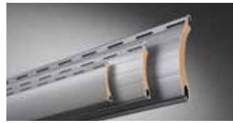
ALUMINO, doppelwandig, umweltfreundlich ausgeschäumt