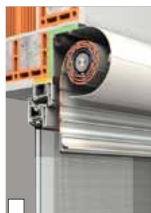
Standardmontage als Linksroller in die Laibung (Abb. XP-System im monolithischen Mauerwerk mit Sonderausstattung Insektenschutzgitter)