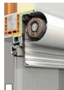
Standardmontage als Linksroller in die Laibung (Abb. XP-System im Wärmedämmverbundsystem mit Sonderausstattung Insektenschutzgitter)