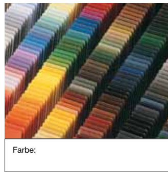
ROMA ColorCollection (Standard) oder andere Farben (Sonderfarben)