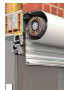
Standardmontage als Linksroller in die Laibung (Abb. XP-System in Klinkerfassade mit Sonderausstattung Insektenschutzgitter)